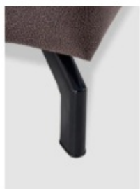
2. noha kov odstín černá