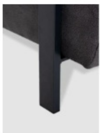
1. rámová noha kov odstín černá