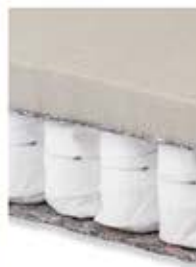
pružiny + HR pěna