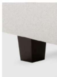
4. dřevěná noha různé odstíny moření