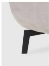
3. komax noha kov odstín černá a stříbrná