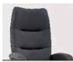
Záda 2 Výška: 109–113 cm Délka v ležaté poloze: 168–173 cm