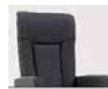
Záda 3 Výška: 112–116 cm Délka v ležaté poloze: 171–176 cm