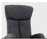
Záda 1 Výška: 106–110 cm Délka v ležaté poloze: 165–170 cm

Lze kombinovat různé typy zad a područek za stejnou cenu. Výběrem kombinace zad a područky si zvolíte správnou modelovou optiku.