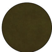
RACING GREEN M2109